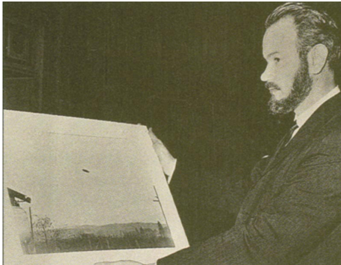
John A. Keel, Schöpfer des Begriffes »MIB«, Men In Black

In den folgenden Tagen besteigt Deppé-Nielssen von Zermatt aus das Matterhorn. Auf dem Berg kommt es zu einer spektakulären Begegnung mit zwei großen, menschlich wirkenden Außerirdischen vom Planeten Jupiter, welche Deppé-Nielssen aufgrund ihrer Schönheit