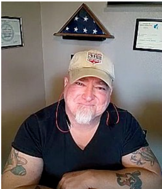
Luis Elizondo (2021)

Dieses Buch ist teilweise auch als seine Autobiographie zu verstehen. Wir erfahren etwas über seinen familiären Hintergrund, seine berufliche Laufbahn beim Militärgeheimdienst und seine Auslandseinsätze in Afghanistan und in Ländern des Nahen Ostens. Überdies war er auch in Guantanamo Bay auf Kuba tätig, wo die USA ein wegen Menschenrechtsverletzungen umstrittenes Militärgefängnis betreiben. Auch an einem Projekt für Fernwahrnehmung (das umstrittene Remote-Viewing) will er teilgenommen haben.